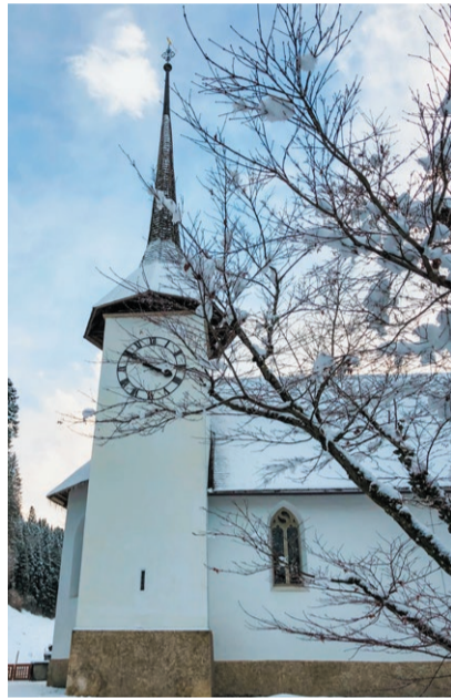
Kirche Eggiwil